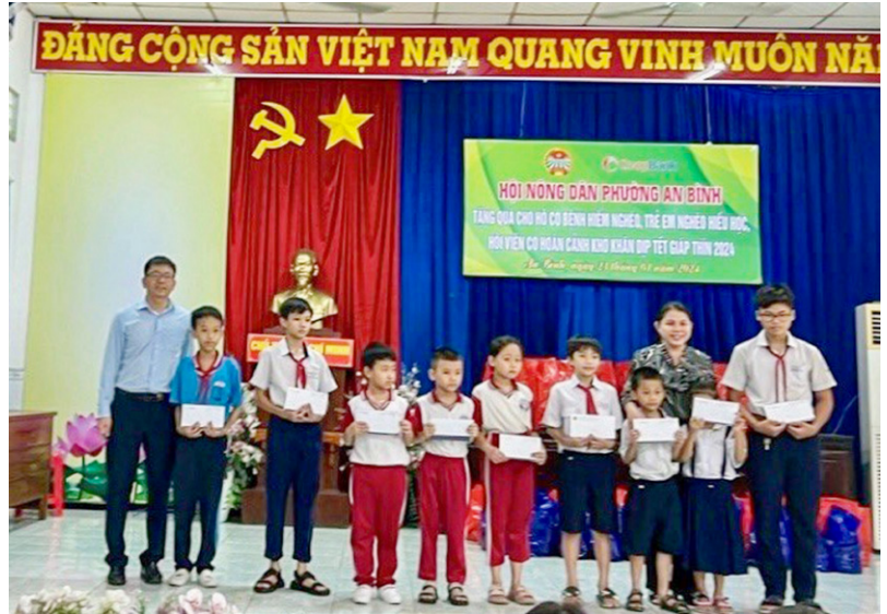
Hội Nông dân phường An Bình, thành phố Dĩ An tặng quà cho trẻ em con hội viên nông dân có hoàn cảnh khó khăn nhân dịp Xuân Giáp Thìn 2024

Với tinh thần luôn sẵn sàng thực hiện tốt nhiệm vụ được giao, Hội Nông dân các cấp trong tỉnh đã khẩn trương phối hợp với các ngành, đoàn thể tuyên truyền đến cán bộ, hội viên nông dân các Nghị quyết, chủ trương của Đảng, chính sách, pháp luật của Nhà nước và của Hội gắn với nhiệm vụ của địa phương, đơn vị; tích cực tham gia các hoạt động mừng Đảng, mừng Xuân và thực hiện các chế độ, chính sách chăm lo Tết Nguyên đán Giáp Thìn năm 2024; vận động cán bộ, hội viên, nông dân tích cực phối hợp, tham gia cùng lực lượng Công an thực hiện các phương án, kế hoạch đảm bảo an ninh trật tự; thực hiện đợt cao điểm đấu tranh trấn áp các loại tội phạm; tập trung đẩy mạnh phòng ngừa các tệ nạn xã hội; thực hiện công tác tuyên truyền đến mỗi cán bộ, hội viên nông dân nâng cao ý thức cảnh giác, chủ động phòng ngừa, tích cực tham gia tố giác tội phạm; phối hợp tuyên truyền, quản lý giáo dục cải tạo người phạm tội, đối tượng hết hạn tù được trở về địa phương, đối tượng vi phạm pháp luật được cảm