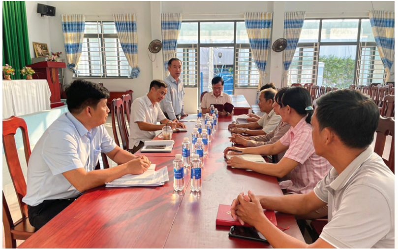
Chi Hội ấp 2, Hội Nông dân xã Trừ Văn Thố, huyện Bàu Bàng, sinh hoạt chi Hội quý I năm 2024

2. Tuyên truyền sâu, rộng trong cán bộ, hội viên nông