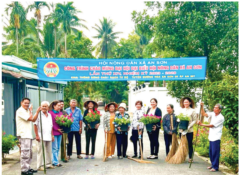
Hội viên nông dân xã An Sơn tổ chức khai thông dòng chảy nhằm thực hiện công trình chào mừng Đại hội Đại biểu Hội Nông dân xã An Sơn lần thứ XIV, nhiệm kỳ 2023-2028.

Tại các buổi họp chi hội, Hội vận động, tuyên truyền cán bộ, hội viên nông dân tham gia thực hiện tốt phong trào “Toàn dân bảo vệ an ninh Tổ quốc”, phòng, chống các loại tội phạm, tệ nạn xã hội... góp phần giữ vững tình hình an ninh chính trị, trật tự an toàn xã hội. Hội còn duy trì hoạt động câu lạc bộ Nông dân với Pháp luật làm nòng cốt trong công tác tuyên truyền về môi trường, đất đai, an ninh trật tự, phòng chống dịch bệnh,