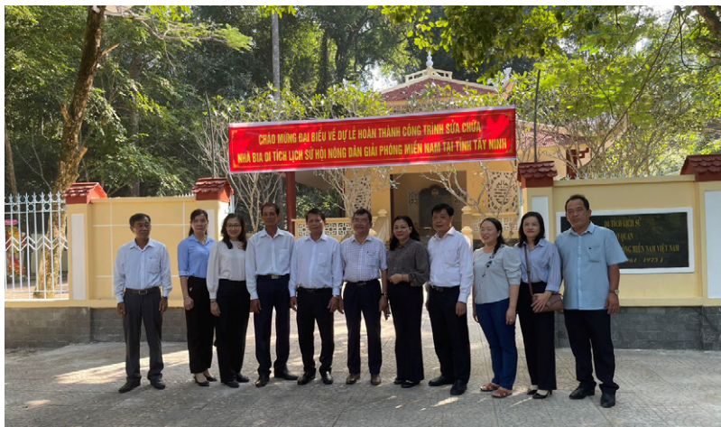
Lãnh đạo cơ quan Thường trực Trung ương Hội Nông dân Việt Nam tại miền Nam và lãnh đạo Hội Nông dân các tỉnh, thành phố tham dự Lễ hoàn thành công trình sửa chữa Nhà bia Di tích lịch sử Hội Nông dân Giải phóng miền Nam tại tỉnh Tây Ninh

Sau khi ra đời, Hội Nông dân Giải phóng miền Nam công khai hoạt động, tổ chức nông cốt chuyên đổi thành tiểu tổ Nông hội và Ban cán sự Nông hội thôn, ấp. Tổ chức Hội đã phát triển nhanh chóng về số lượng, chất lượng và làm nông cốt trên các mặt trận đấu tranh cách mạng. Trước thắng lợi liên tiếp của quân và dân miền Nam, tháng 5/1961 đế quốc Mỹ quyết định thi hành “chiến lược chiến tranh đặc biệt” ở miền Nam, chúng kết hợp 3 biện pháp chiến lược cơ bản: Tim diệt bộ đội cộng sản, triệt tiêu cơ sở cách mạng và phong tỏa biên giới trên đất liền, vùng biển và kết