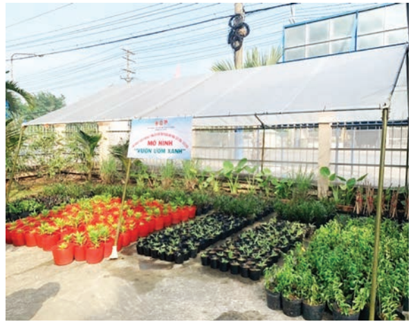
Mô hình "Vườn ươm xanh" tại UBND phường Bình Thắng, thực hiện Đề án 02

dân tham gia phong trào bảo vệ an ninh tổ quốc",... Đặc biệt, tổ chức Hội luôn chủ động, tích cực phối hợp duy trì và phát huy hiệu quả bằng phương thức kết nối xã hội hóa vận động thêm nguồn lực để thực hiện mở rộng vườn ươm, nhằm tô thêm nét đẹp các tuyến đường, phủ xanh các công viên, chung sức bảo