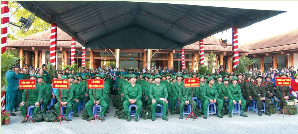
Thanh niên trúng tuyển huyện Bắc Tân Uyên tại Lễ giao quân.

Đ ể góp phần cùng Hội đồng Nghĩa vụ quân sự hoàn thành tốt chỉ tiêu công tác tuyển quân năm 2024, với vai trò là thành viên Hội đồng Nghĩa vụ quân sự các cấp. Ngày từ đầu năm gắn với công tác Hội và phong trào nông dân, các cấp Hội Nông dân trong tỉnh căn cứ theo chức năng, nhiệm vụ của tổ chức Hội đã phối hợp tổ chức triển khai công tác tuyên truyền, vận động con em nông dân và thanh niên trong độ tuổi thực hiện Luật Nghĩa vụ quân sự hăng hái lên đường thực hiện nghĩa vụ quân sự.