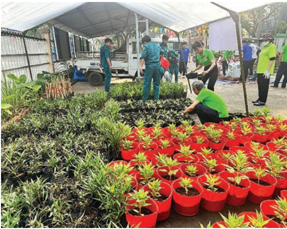
Hội viên, đoàn viên và chiến sĩ ươm cây vào bầu giống