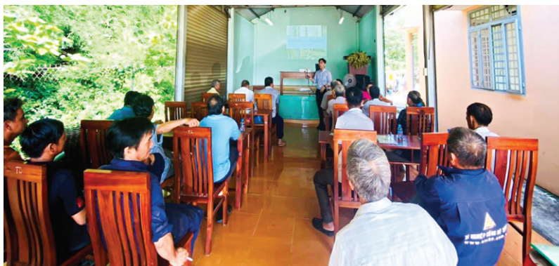
Hội Nông dân phường Thạnh Phước phối hợp với Trung tâm Dịch vụ Nông nghiệp thành phố Tân Uyên tổ chức tập huấn sản xuất lúa theo hướng VietGAP đến hội viên nông dân trên địa bàn phường.

Hội Nông dân các huyện, thị xã, thành phố còn phối hợp tổ chức lớp đào tạo nghề “trồng bưởi theo tiêu chuẩn VietGAP”; phối hợp với Trạm Khuyến nông, Trạm Bảo vệ thực vật, công ty phân bón tổ chức tập huấn, hội thảo cho hội viên nông dân chuyên giao khoa học kỹ thuật về cây lúa, rau an toàn, hoa lan, nấm bào ngư, phòng bệnh trên rau màu và cao su, VietGAP, quản lý sử dụng phân bón và thuốc bảo vệ thực vật... Kết quả trong quý I có 24 lớp được