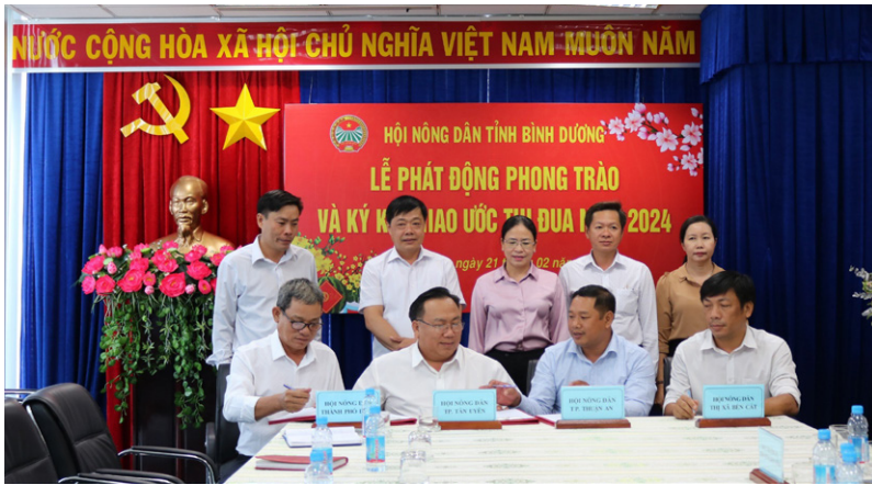
Hội Nông dân tỉnh tổ chức Lễ phát động phong trào và ký kết giao ước thi đua năm 2024.

văn hóa, giữ gìn và phát huy những giá trị truyền thống văn hóa tốt đẹp, thực hiện nếp sống văn hóa, văn minh trong việc cưới, việc tang và lễ hội; tổ chức các hoạt động văn hóa, văn nghệ, thể thao nâng cao đời sống văn hóa, tinh thần của hội viên, nông dân.