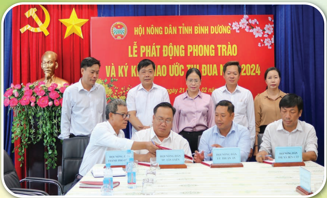
Các đơn vị tham gia ký kết giao ước thi đua năm 2024