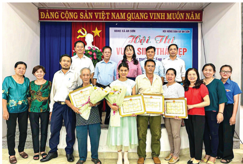
Lễ trao giải Hội thi vườn sinh thái đẹp năm 2023

Song song đó, Hội xây dựng, phát triển các mô hình kinh tế có hiệu quả và vận động, hướng dẫn, hỗ trợ nông dân tham gia phát triển các hình thức kinh tế tập thể trong nông nghiệp. Trong năm, Hội tích cực hỗ trợ xây dựng và nhân rộng các mô hình kinh tế tập thể; thường xuyên phối hợp với các ngành tư vấn, hướng dẫn hỗ trợ các tổ hợp tác, chi hội nông dân nghề nghiệp và tham gia