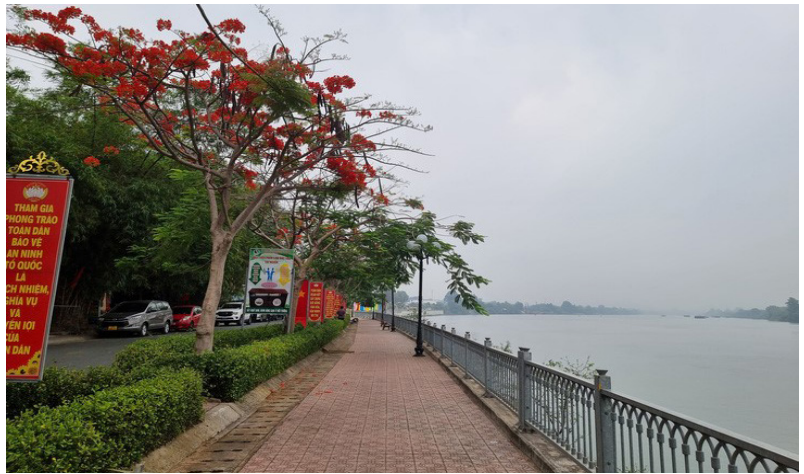
Công viên quảng trường Thành phố Tân Uyên - giáp sông Đồng Nai

Sau khi thành lập, thành phố Tân Uyên có 12 đơn vị hành chính cấp xã, gồm 10 phường: Hội Nghĩa, Khánh Bình, Phú Chánh, Tân Hiệp, Tân Phước Khánh, Tân Vĩnh Hiệp, Thái Hòa, Thạnh Phước, Uyên Hưng, Vĩnh Tân và 02 xã: Bạch Đằng, Thạnh Hội. Với vị trí địa lý đặc biệt, thành phố Tân Uyên là địa bàn quan trọng của tỉnh cả về chính trị, quân sự, kinh tế và văn hóa, xã hội, thuận lợi trong việc thu hút đầu tư các ngành như công nghiệp, dịch vụ, thương mại. Trên địa bàn thành phố có hệ thống giao thông đối ngoại, giúp việc giao thương, vận chuyển hàng hóa luân chuyển đi các tỉnh, thành phía Nam; có cảng Thạnh Phước là cảng sông đầu tiên của thành phố, mở ra nhiều cơ hội