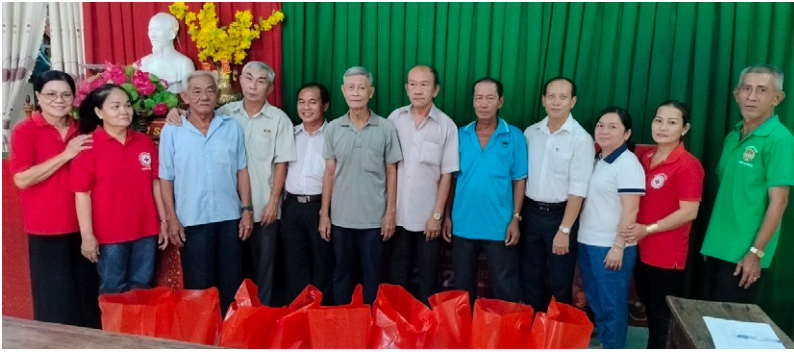
Hội Nông dân phường An Thạnh, thành phố Thuận An tặng quà cho hội viên, nông dân có hoàn cảnh khó khăn nhân dịp Xuân Giáp Thìn 2024