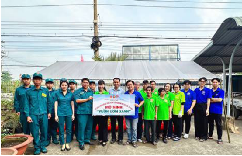
Lễ ra mắt mô hình “Vườn ươm xanh”

Thực hiện Đề án “Công tác dân vận tham gia xây dựng nếp sống văn hóa - văn minh” trên địa bàn tỉnh Bình Dương giai đoạn 2021 – 2025 (gọi tắt là Đề án 02), các cơ quan, Mặt trận Tổ quốc và các tổ chức chính trị - xã hội, đơn vị có liên quan xây dựng và tổ chức thực hiện Đề án gắn với việc thực hiện các chương trình, phong trào, đề án, cuộc vận động của đơn vị mình, chú trọng nhân rộng các mô hình hiệu quả, thu hút đoàn viên, hội viên và nhân dân tham gia.