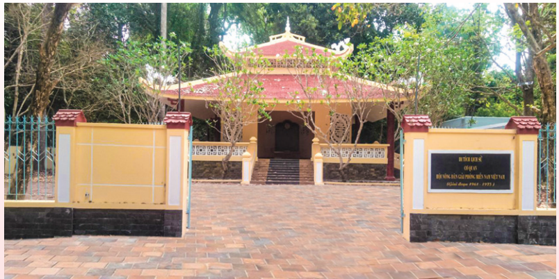
Di tích lịch sử cơ quan Hội Nông dân giải phóng miền Nam tại tỉnh Tây Ninh

nghĩa giành chính quyền về tay nhân dân. Phương pháp đấu tranh hợp pháp, nửa hợp pháp, kết hợp chặt chẽ 3 vùng: đô thị, đồng bằng và rừng núi. Trên tinh thần đó, Hội nghị xác định phải thành lập một mặt trận rộng rãi ở miền Nam nhằm tập hợp tất cả các lực