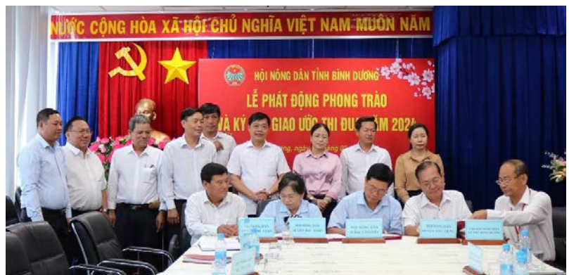
Lãnh đạo Ban Dân vận Tỉnh ủy, Thường trực Hội Nông dân tỉnh chứng kiến các đơn vị ký kết giao ước thi đua năm 2024

3. Tiếp tục nâng cao chất lượng đội ngũ cán bộ Hội các cấp để đáp ứng yêu cầu nhiệm vụ cách mạng trong giai đoạn mới và 100% cán bộ Hội chuyên trách cấp tỉnh, huyện, thị, thành phố, cán bộ chủ chốt cơ sở và chi hội trưởng được đào tạo, bồi dưỡng, tập huấn nghiệp vụ công tác Hội và kỹ năng công tác vận động quần chúng.