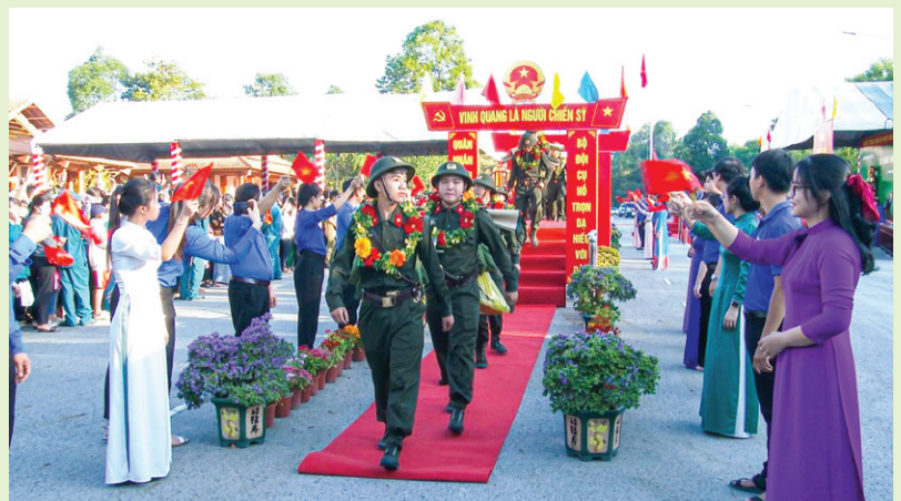
Thanh niên trúng tuyển huyện Bắc Tân Uyên lên đường nhập ngũ.

Phối hợp với các ban ngành, đoàn thể tuyên truyền và vận động thanh niên trúng tuyển lên đường nhập ngũ là 1608/1906 thanh niên (thành phố Thủ Dầu Một không còn tổ chức Hội Nông dân); Trong đó, (con em của cán bộ, hội viên nông dân là 475 thanh