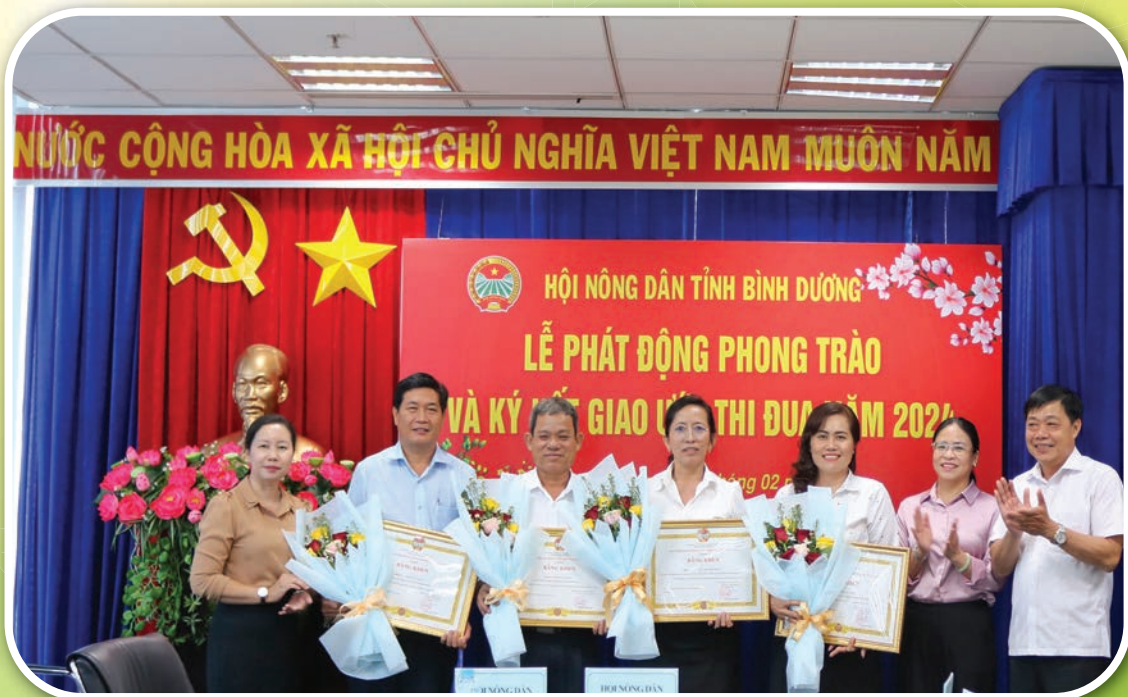
Thường trực Hội Nông dân tỉnh Bình Dương trao bằng khen của Ban Chấp hành Trung ương Hội Nông dân Việt Nam cho các cá nhân đạt thành tích xuất sắc năm 2023