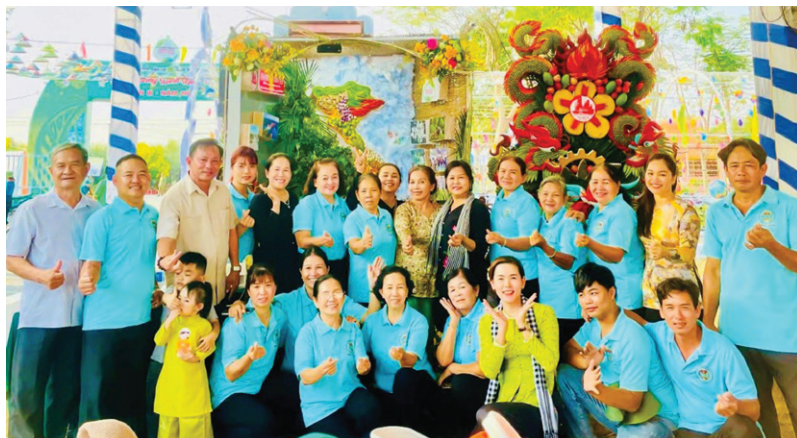
Hội Nông dân phường Tân Vĩnh Hiệp, thành phố Tân Uyên tham gia Hội thi Nghệ thuật tạo hình từ hoa quả tại Lễ hội “Hương bưởi Bạch Đằng” lần thứ 3 với chủ đề “Tân Uyên niềm tin - phát triển”.

Nằm trong chuỗi các hoạt động chào mừng Đại hội đại biểu toàn quốc Hội Nông dân Việt Nam lần thứ VIII, nhiệm kỳ 2023-2028, Ban Thường vụ Hội Nông dân tỉnh đã tổ chức hội thảo “Người nông dân văn minh - hiện đại”. Bên cạnh đó, Ban Thường vụ Hội Nông dân tỉnh tổ chức hội nghị đối thoại, gặp gỡ giữa Chủ tịch Ủy ban nhân dân tỉnh với cán bộ, hội viên nông dân Bình Dương năm 2023 với chủ đề “Phát huy nội lực, lợi thế tỉnh Bình Dương, đẩy mạnh phong trào nông dân, phát huy kinh tế nông nghiệp bền vững”. Hội nghị đối thoại có hơn 120 đại biểu là cán bộ, hội viên nông dân, các hợp tác xã, các doanh nghiệp trong lĩnh vực nông nghiệp tham gia. Đồng thời, tỉnh Hội tổ chức hội nghị tổng kết phong trào nông dân thi đua sản xuất - kinh doanh giỏi giai đoạn 2021-2023 và trao giải thưởng “Nông dân