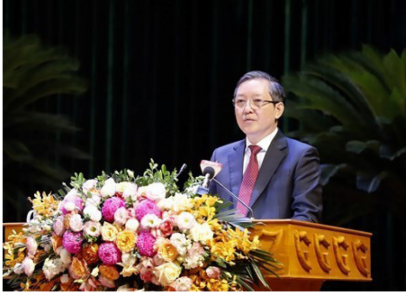
Đồng chí Lương Quốc Đoàn, Ủy viên Trung ương Đảng, Bí thư Đảng đoàn, Chủ tịch Ban Chấp hành Trung ương Hội Nông dân Việt Nam

Củng cố, kiện toàn tổ chức bộ máy Hội Nông dân các cấp tinh gọn, hoạt động hiệu quả; xây dựng đội ngũ cán bộ hội đủ phẩm chất và năng lực đáp ứng yêu cầu nhiệm vụ; phát triển và nâng cao chất lượng hội viên. Xây dựng đội ngũ cán bộ hội các cấp bảo đảm