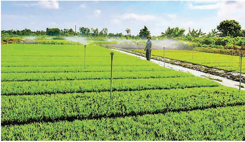
Mô hình ứng dụng cảm biến trong hệ thống tưới phun tự động tại HTX rau an toàn Hòa Phát giúp tiết kiệm hơn 50% chi phí sản xuất.

mặn, pH, NH 4 , DO và nhiệt độ theo thời gian. Đặc biệt, hệ thống giúp cho nông dân chủ động quyết định thời gian phù hợp để cấp nước thêm cho ruộng tạo sự ổn định cho môi trường nước ruộng nuôi, nâng được tỷ lệ sống của tôm, tăng hiệu quả kinh tế