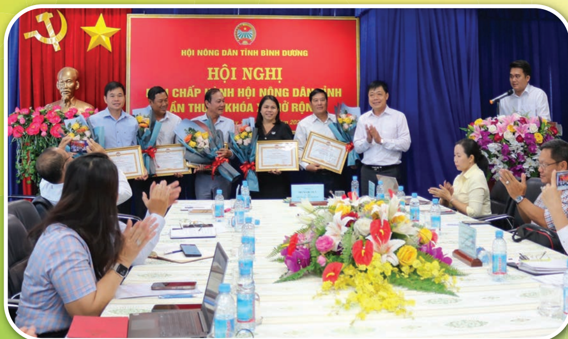
Khen thưởng các tập thể đạt thành tích xuất sắc trong công tác Hội và phong trào nông dân năm 2023