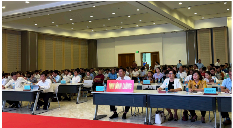
Thường trực Hội Nông dân tỉnh Bình Dương tham dự Hội nghị trực tuyến triển khai quán triệt Nghị quyết 46 của Bộ Chính trị, Nghị quyết Đại hội VIII Hội Nông dân Việt Nam

Tập trung tuyên truyền sâu rộng trong cán bộ, hội viên, nông dân về các ngày kỷ niệm, ngày lễ lớn, sự kiện lịch sử quan trọng của Đảng, của đất nước trong năm 2024, cùng với những sự kiện lịch sử quan trọng nhân dịp kỷ niệm năm tròn, đẩy mạnh tuyên truyền công lao to lớn nhân dịp kỷ niệm năm tròn ngày sinh các đồng chí lãnh đạo chủ chốt của Đảng, Nhà nước; lãnh đạo tiên phong tiêu biểu của Đảng và cách mạng Việt Nam. Gắn việc tuyên truyền kỷ niệm các ngày lễ lớn và sự kiện lịch sử của đất nước với việc tuyên truyền về lịch sử Hội và phong trào nông dân qua các giai đoạn phát triển.