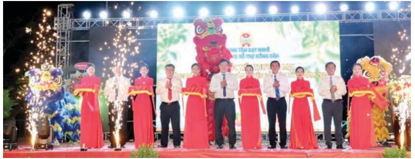
Thường trực Hội Nông dân tỉnh tham dự khai mạc Hội chợ xúc tiến thương mại, quảng bá sản phẩm tại huyện Bắc Tân Uyên

Theo đó các cấp Hội trong tỉnh đã quán triệt, triển khai thực hiện nghiêm túc, có hiệu quả các quan điểm, mục tiêu, nhiệm vụ, giải pháp chủ yếu tại Nghị quyết số 46-NQ/TW và Nghị quyết Đại hội Hội Nông dân các cấp xây dựng kế hoạch thực