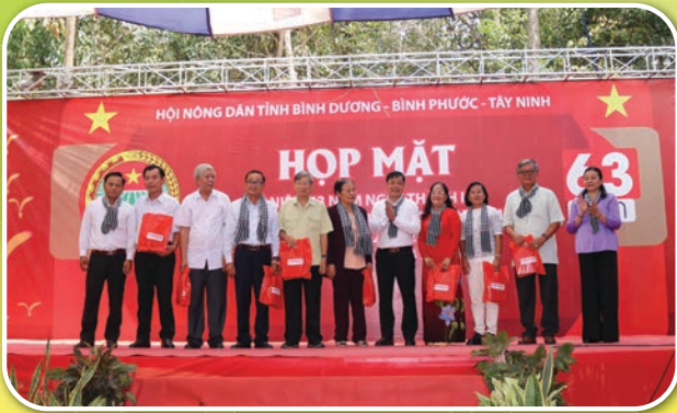
Lãnh đạo Hội Nông dân 03 tỉnh Bình Dương - Bình Phước - Tây Ninh tặng quà tri ân các đồng chí Nguyên Lãnh đạo Hội Nông dân qua các thời kỳ