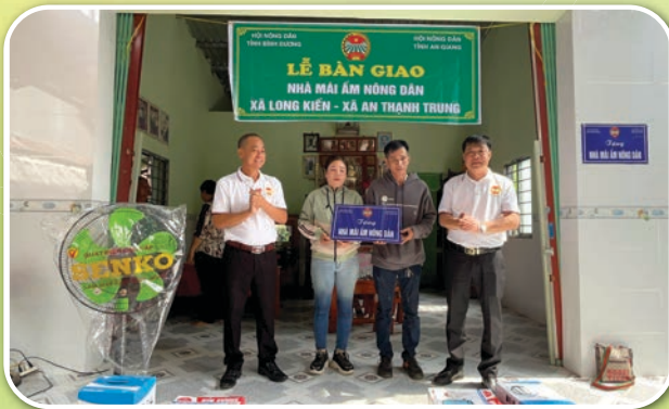
Hội Nông dân tỉnh Bình Dương phối hợp với Hội Nông dân tỉnh An Giang trao tặng Mái ấm nông dân