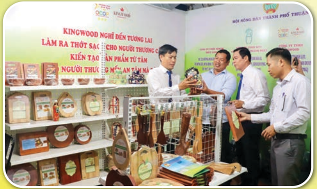
Thường trực Hội Nông dân tỉnh Bình Dương tham quan triển lãm sản phẩm nông nghiệp tiêu biểu năm 2024