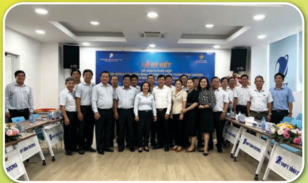
Lễ ký kết Kế hoạch hoạt động giữa Hội Nông dân tỉnh Bình Dương và Viễn thông Bình Dương (VNPT) năm 2024