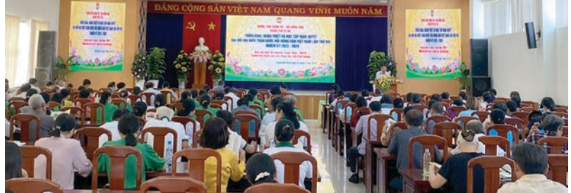
Quang cảnh triển khai quán triệt Nghị quyết

X ác định công tác tuyên truyền, vận động là nhiệm vụ quan trọng trong công tác Hội và phong trào nông dân, những năm qua, các cấp Hội đã tập trung đẩy mạnh đổi mới nội dung, đa dạng hóa các hình thức tuyên truyền vận động hội viên, nông dân nhằm nâng cao chất lượng, hiệu quả công tác tuyên truyền theo tinh thần Nghị quyết 19 của BCH Trung ương Hội khóa (VI) "Về tăng cường và đổi mới công tác tuyên truyền, vận động trong tình hình mới". Các cấp Hội đã bám sát nhiệm vụ chính trị, thực tế địa phương và đời sống của cán bộ, hội viên, nông dân để tổ chức quán triệt, xây dựng kế hoạch và triển khai thực hiện có hiệu quả các nghị quyết của Cấp ủy, của Hội cấp trên, nhất là các chủ trương, nghị quyết liên quan đến nông nghiệp, nông dân, nông thôn; các chương trình phát triển kinh tế - xã hội của địa phương. Đặc biệt nhằm nâng cao chất lượng, hiệu quả công tác tuyên truyền của Hội đó là đa dạng các hình thức tuyên truyền, đổi mới nội dung tuyên truyền có trọng tâm, trọng điểm. Qua 10 năm thực hiện Nghị quyết 19, các cấp Hội tổ chức được 13.332 cuộc cho 568.283 lượt cán bộ, hội viên tham gia học tập các chủ trương của Đảng, chính sách, pháp luật của Nhà nước, các Chỉ thị, Nghị quyết của Hội. Phối hợp với Trường cán bộ Hội và các sở, ban