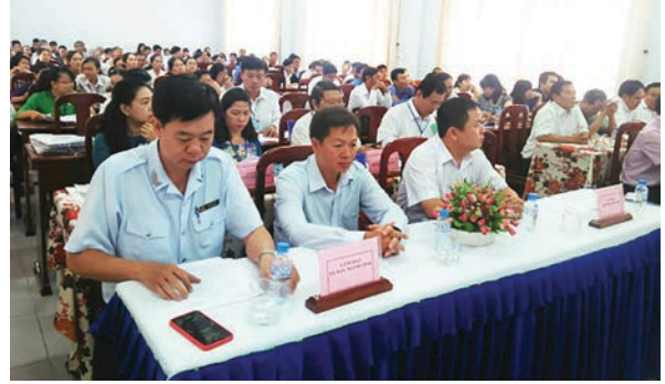
Quang cảnh hội thi tuyên truyền pháp luật

tình hình an ninh chính trị, trật tự an toàn xã hội ở địa phương.