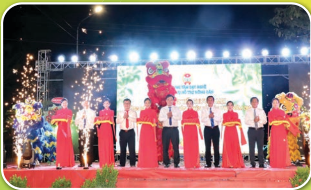
Thường trực Hội Nông dân tỉnh tham dự khai mạc Hội chợ xúc tiến thương mại, quảng bá sản phẩm huyện Bắc Tân Uyên năm 2024