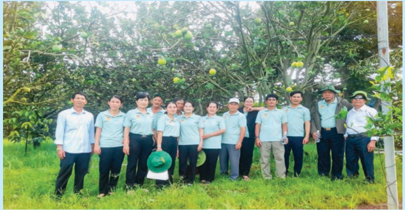
Cán bộ, hội viên nông dân phường Uyên Hưng tham quan mô hình tại Hợp tác xã Dân Tiến, xã Tân Định, huyện Bắc Tân Uyên