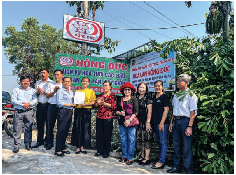
Hộ nông dân sản xuất kinh doanh giỏi trên địa bàn tỉnh Bình Dương

Hộ đạt danh hiệu nông dân sản xuất kinh doanh giỏi các cấp là cơ sở, căn cứ để cử các hình thức biểu dương, khen thưởng, giải thưởng, suy tôn như: đề xuất Bằng khen, Giấy khen của Ban