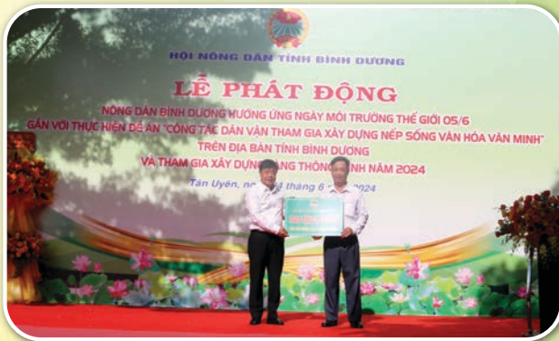
Hội Nông dân tỉnh trao tặng công trình phục vụ cộng đồng tại "Công viên nông dân" 20 bộ gạch đá trị giá 10 triệu đồng cho Hội Nông dân xã Bạch Đằng