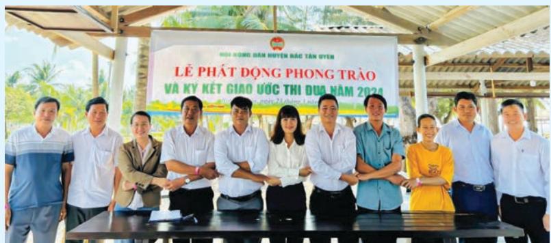
Hội Nông dân huyện Bắc Tân Uyên tổ chức Lễ phát động phong trào và ký kết giao ước thi đua năm 2024

Ban Thường vụ Hội Nông dân tỉnh phối hợp Trung ương Hội Nông dân Việt Nam tổ chức Hội nghị trực tuyến học tập, quán triệt triển khai Nghị quyết số 46-NQ/TW, ngày 20/12/2023 của Bộ Chính trị về đổi mới, nâng cao chất lượng hoạt động của Hội Nông dân Việt Nam đáp ứng yêu cầu nhiệm vụ cách mạng trong giai đoạn mới; Nghị quyết Đại hội Đại biểu toàn quốc Hội Nông dân Việt Nam lần thứ VIII, nhiệm kỳ 2023-2028; Quyết định số 182/QĐ-TTg, ngày 20/02/2024 của Thủ tướng Chính phủ phê duyệt Đề án “Hội Nông dân Việt Nam tham gia phát triển kinh tế tập thể trong nông nghiệp” có trên 500 cán bộ, UVBCH