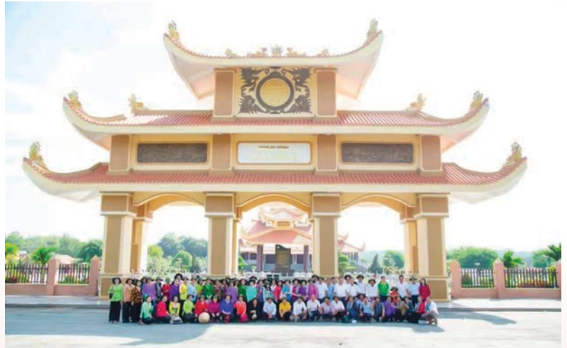
Hội Nông dân thành phố Tân Uyên tổ chức cho hội viên nông dân tham quan Khu di tích lịch sử Chiến khu Vĩnh Lợi

Thấm nhuần tư tưởng của Bác: “Thi đua là yêu nước, yêu nước thì phải thi đua”, từ đó, các cấp Hội càng ra sức