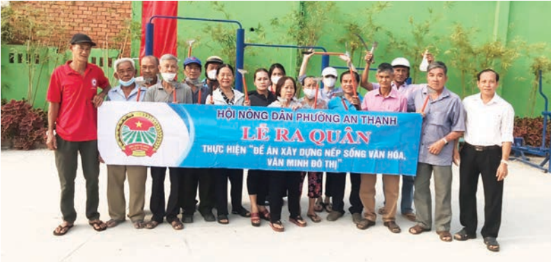
Hội Nông dân phường An Thạnh ra quân thực hiện "Đề án xây dựng nếp sống văn hóa, văn minh đô thị"

kiện mở rộng sản xuất phát triển kinh tế gia đình ổn định cuộc sống; Thực hiện chỉ đạo của Hội cấp trên, Hội Nông dân phường đã đẩy mạnh công tác tuyên truyền, vận động, góp phần làm thay đổi nhận thức của hội viên nông dân về phát triển sản xuất nông nghiệp, kinh tế hộ gia đình và chung tay xây dựng nông thôn mới, đô thị văn minh. Hàng năm bản thân đã định hướng cho hội viên phát triển kinh tế phù hợp với thực tiễn ở địa phương, nhất là nhu cầu, xu hướng thị trường sản xuất hàng hóa hiện nay. Tích cực vận động, hướng dẫn hội viên tham gia phát triển kinh tế tập thể, liên kết sản xuất, mở rộng các hoạt động dịch vụ, tăng cường phối hợp tổ chức các chương trình tập huấn, chuyển giao hoa học kỹ thuật về trồng trọt, chăn nuôi nhằm thu hút hội viên; trên cơ sở bám sát chủ trương, nghị quyết, chính sách, chương trình của địa phương, sự chỉ đạo của Hội cấp trên đã xây dựng và phát triển được các tổ Kinh tế hợp tác đang đi vào hoạt động và có hiệu quả điển hình như: Tổ kinh tế hợp tác (KTHT) sản xuất rau an toàn, Tổ KTHT chăm sóc vườn cây,