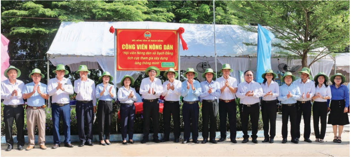
Lễ ra mắt mô hình Công viên nông dân tại ấp Tân Trạch, xã Bạch Đằng, thành phố Tân Uyên