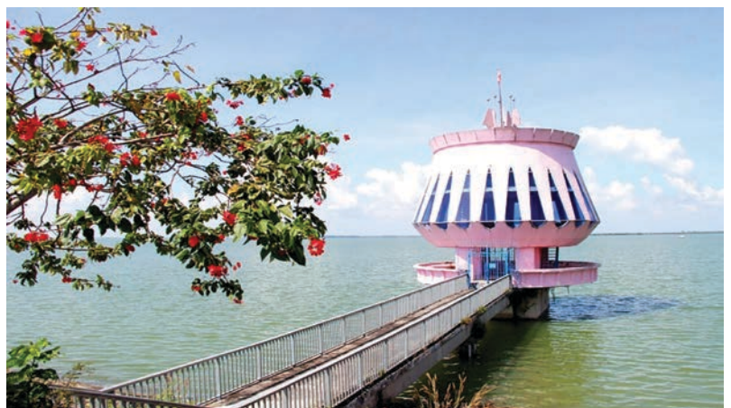
Hồ thủy điện Dầu Tiếng

Ngoài các hệ thống sông lớn trên địa bàn, tỉnh Bình Dương còn có một số hồ nước lớn như hồ Dầu Tiếng, Càn