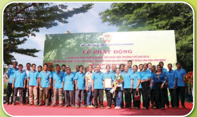
Chi Hội nông dân nghề nghiệp (Hội quán nông dân) xã Bạch Đằng, thành phố Tân Uyên tham gia hưởng ứng các hoạt động Ngày Môi trường thế giới 5/6