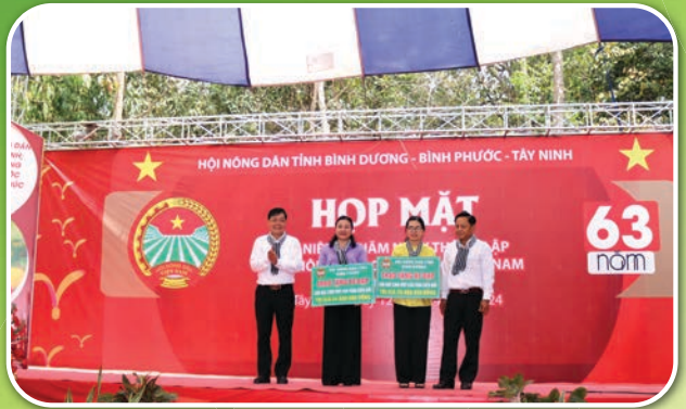
Lãnh đạo Hội Nông dân 02 tỉnh Bình Dương và Bình Phước trao tặng xe đạp cho học sinh vượt khó vùng biên giới của tỉnh Tây Ninh