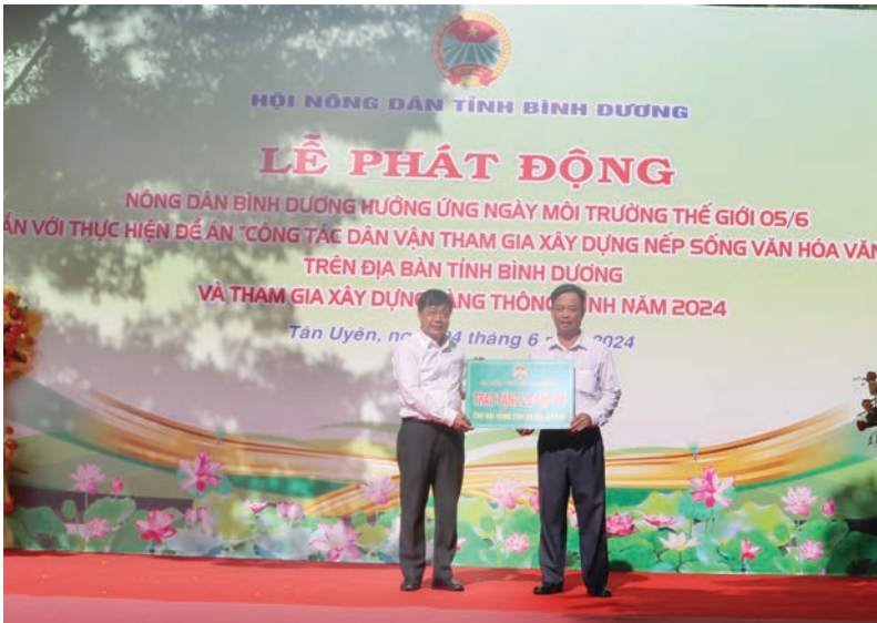
Hội Nông dân tỉnh trao tặng công trình phục vụ cộng đồng tại "Công viên nông dân" 20 bộ ghế đá trị giá 10 triệu đồng cho Hội Nông dân xã Bạch Đằng

Bên cạnh đó, các cấp Hội Nông dân trong tỉnh còn triển khai thực hiện cơ quan văn hóa, văn hóa công sở và trụ sở xanh, sạch, đẹp.