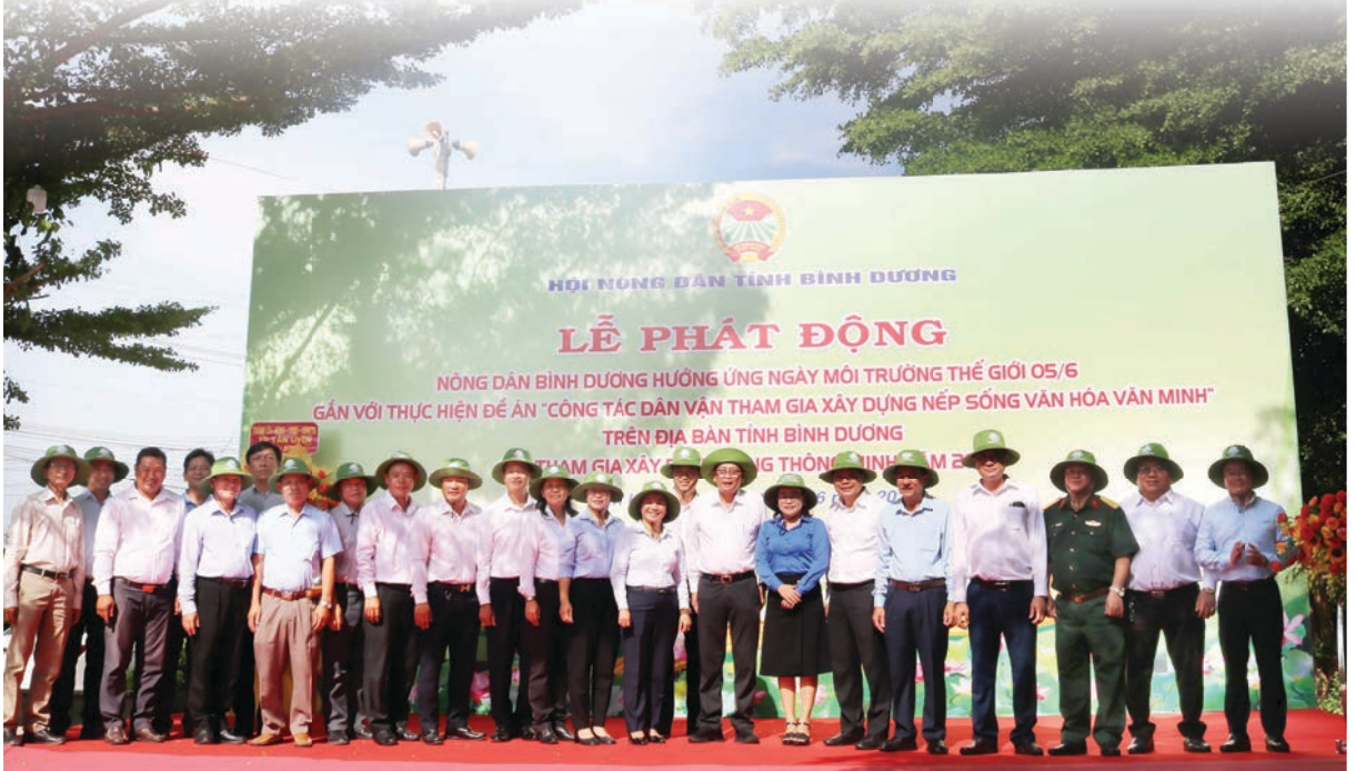
Đại biểu tham dự Lễ phát động hưởng ứng Ngày môi trường thế giới 5/6