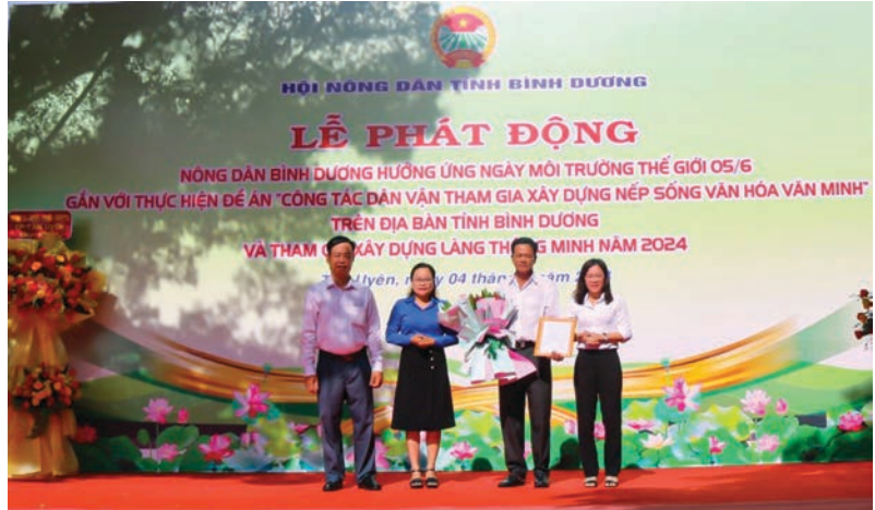
Lãnh đạo xã Bạch Đằng trao quyết định thành lập Chi hội nông dân nghề nghiệp xã Bạch Đằng (mô hình Hội quán)

T rong những năm qua, công tác phát triển hội viên được mở rộng đối tượng theo Điều lệ Hội Nông dân Việt Nam và sự quan tâm của Hội Nông dân các cấp trong tỉnh. Xác định đoàn kết, tập hợp đông đảo nông dân vào tổ chức Hội, phát triển và nâng cao chất lượng hội viên là một trong các nhiệm vụ trọng tâm của các cấp Hội; vai trò của Hội trong thực hiện chức năng tập hợp vận động giáo dục hội viên được các cấp ủy Đảng, chính quyền đánh giá cao. Hội viên không ngừng được củng cố nâng cao về chất lượng. Chất lượng hội viên không ngừng được nâng lên thông qua các chỉ tiêu như độ tuổi ngày càng trẻ hơn; có trình độ học vấn, chuyên môn, lý luận chính trị nhiều hơn, thậm chí đã có hội viên tham gia đại biểu hội đồng nhân dân các cấp; tỷ lệ hội viên tham gia sinh hoạt Hội tăng, 100% hội viên tham gia đóng hội phí và xây dựng quỹ Hội; tham gia sinh hoạt Hội nghiêm túc và đi vào nề nếp; nhiều hội viên hoạt động tích cực, năng động trong phát triển kinh tế, đã hình thành nhiều mô hình cho hiệu quả kinh tế cao. Bên cạnh phát triển kinh tế giỏi, hội viên tích cực tham gia các phong trào do địa phương và Hội phát động, góp phần quan trọng