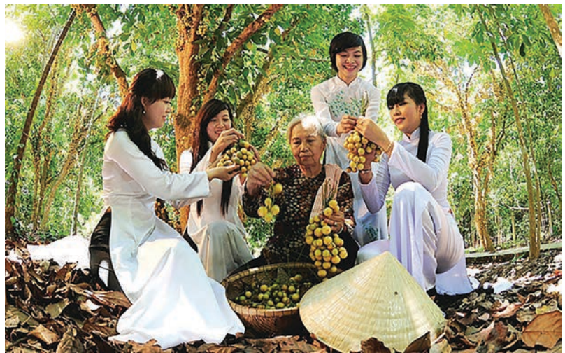
Du khách tham quan vườn cây ăn trái ở thành phố Thuận An, tỉnh Bình Dương.

nông thôn mới giai đoạn 2021-2025 và Quyết định số 05/QĐ-BCĐTW-VPĐPNTM ngày 12/10/2022 của Ban Chỉ đạo Trung ương các Chương trình mục tiêu quốc gia giai đoạn 2021-2025, tỉnh đã ban hành kế hoạch số 893/KH-UBND Triển khai thực hiện Chương trình phát triển du lịch nông thôn trong xây dựng nông thôn mới giai đoạn 2021-2025 trên địa bàn tỉnh Bình Dương. Là một tỉnh có nhiều mô hình nông nghiệp ứng dụng công nghệ cao quy mô lớn với các loại hình nhà vườn, nông trại, doanh nghiệp hoạt động trong lĩnh vực nông nghiệp, Bình Dương có tiềm năng để khai thác loại hình du lịch nông nghiệp. Bên cạnh đó, tỉnh cũng đã phê duyệt quy hoạch định hướng phát triển ngành nông nghiệp của tỉnh theo hướng nông nghiệp ứng dụng công nghệ cao,