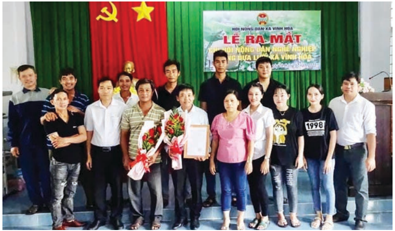
Lễ ra mắt chi hội nông dân nghề nghiệp trồng dưa lưới xã Vĩnh Hòa, huyện Phú Giáo

Cán bộ, hội viên, nông dân xã Vĩnh Hòa đã nhận thức và hưởng ứng thực hiện phong trào nông dân thi đua sản xuất kinh doanh giỏi, đoàn kết giúp nhau làm giàu và giảm nghèo bền vững, vì đây là phong trào chủ lực, cốt lõi của tổ chức Hội hiện nay. Hội Nông dân xã tích cực đổi mới nội dung phương thức lãnh đạo, chỉ đạo và triển khai thực hiện phong trào, tập trung hướng về chi Hội, nắm tình hình nhằm tháo gỡ khó khăn, vướng mắc trong thực hiện phong trào. Chuyển mạnh từ hình thức tuyên truyền, vận động sang hoạt động tư vấn, hỗ trợ giúp hội viên nông dân về vốn, vật tư nông nghiệp, chuyên giao khoa học kỹ thuật, thị trường, đặc biệt là các loại cây ăn quả có giá trị kinh tế cao như sầu riêng, dưa... góp phần giúp nông dân chủ động trong phát triển sản xuất, kinh doanh.