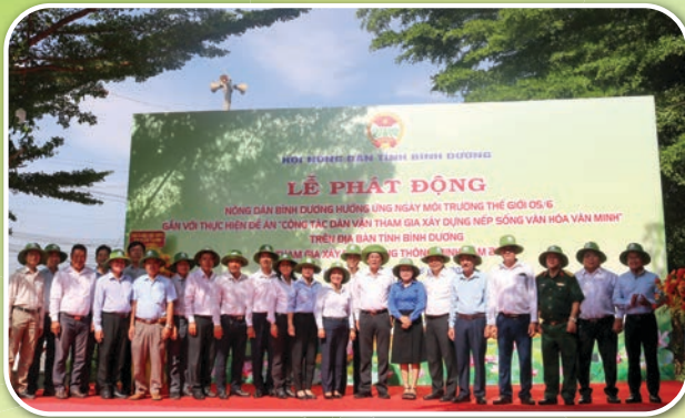
Đại biểu tham dự Lễ phát động hưởng ứng Ngày Môi trường thế giới 5/6