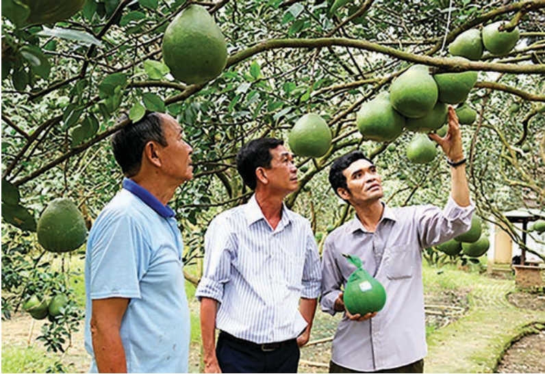
Nông dân trồng bưởi đường lá cam ở Làng thông minh xã bạch Đằng, thành phố Tân Uyên