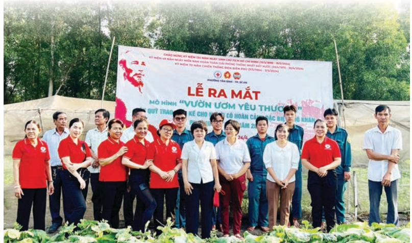
Lễ ra mắt mô hình “Vườn ươm yêu thương” phường Tân Bình, thành phố Dĩ An

Hội Nông dân các cấp thành phố Dĩ An đã chủ động, sáng tạo và đổi mới nhiều nội dung, phương thức hoạt động phù hợp với tình hình thực tế địa phương, công tác tuyên truyền được thực hiện thường xuyên, tập trung tuyên truyền về nội dung, mục đích, ý nghĩa của Đề án 02 và vận động cán bộ, hội viên nông dân và nhân dân cùng tham gia. Hội Nông dân các cấp thành phố Dĩ An đã xây dựng được nhiều mô hình hoạt động hiệu quả, thiết thực và đi vào cuộc sống góp phần nâng cao vai trò, nhận thức của cán bộ, hội