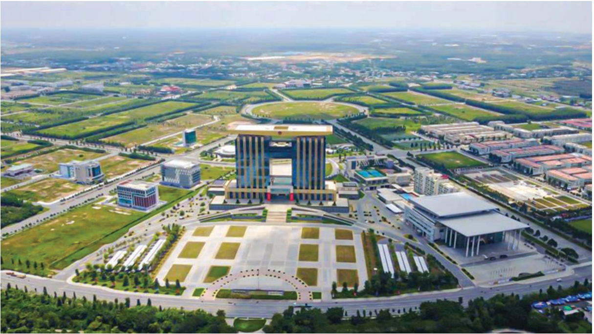
Thành phố thông minh - Vùng đổi mới sáng tạo Bình Dương (Sưu tầm)

những tư tưởng mang tầm thời đại của Cách mạng tháng Tám vào công cuộc đổi mới, đẩy mạnh công nghiệp hóa, hiện đại hóa đất nước và hội nhập quốc tế, quê hương, vì mục tiêu dân giàu, nước mạnh, dân chủ, công bằng, văn minh.