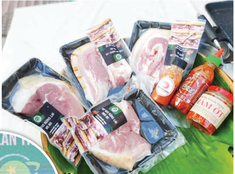
Một số sản phẩm của công ty Nam Anh Group

Năm 2014, sau khi tốt nghiệp cử nhân quản trị kinh