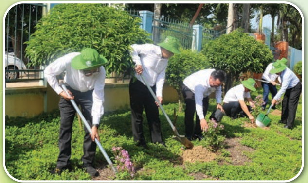
Các đại biểu tham gia trồng cây bảo vệ môi trường tại Lễ phát động hưởng ứng Ngày môi trường thế giới 5/6