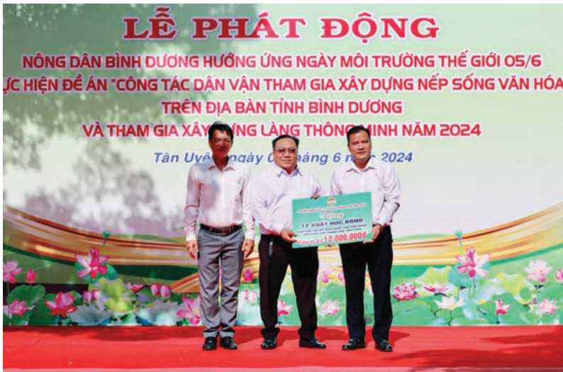
Chi hội Nông dân sản xuất kinh doanh giỏi thành phố Tân Uyên trao tặng 12 phần học bổng cho con em hội viên nông dân có hoàn cảnh khó khăn trên địa bàn Thành phố với tổng trị giá 12 triệu đồng

tham gia các lớp tập huấn, bồi dưỡng nghiệp vụ do Trường cán bộ Hội Nông dân Việt Nam tổ chức bảo đảm 100% số lượng chỉ tiêu được phân bổ. Cụ thể, từ năm 2017 đến năm 2022, Hội Nông dân tỉnh đã cử 28 cán bộ là Chủ tịch, Phó chủ tịch Hội Nông dân cơ sở và 15 cán bộ Hội Nông dân tỉnh, huyện, thành phố tham dự các lớp tập huấn nghiệp vụ do Trường cán bộ Hội tổ chức thời gian từ 07 ngày đến 10 ngày tại Trường cán bộ Trung ương Hội Nông dân Việt Nam; năm 2020, Trường Cán bộ Hội Nông dân Việt Nam phối hợp với Hội Nông dân tỉnh Bình Dương tổ chức 01 lớp tập huấn nghiệp vụ công tác Hội 1 tháng tại Bình Dương cho 73 cán bộ, Chủ tịch, Phó Chủ tịch Hội Nông dân từ tỉnh đến cơ sở; Hội Nông dân tỉnh tổ chức tập huấn bồi dưỡng nghiệp vụ công tác Hội, quỹ Hỗ trợ nông dân,... cho đội ngũ cán bộ