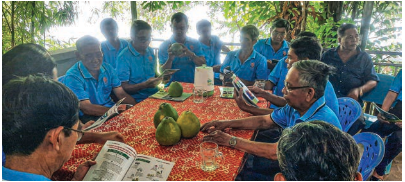
Quang cảnh buổi sinh hoạt Chi Hội (Hội quán nông dân) xã Bạch Đằng, thành phố Tân Uyên

4. Tiếp tục đẩy mạnh tuyên truyền sâu, rộng trong cán bộ, hội viên nông dân Nghị quyết Đại hội đại biểu toàn quốc lần thứ XIII của Đảng; Nghị quyết Đại hội đại biểu Đảng bộ tỉnh lần thứ XI và Nghị quyết Đại hội đảng bộ các cấp, nhiệm kỳ 2020 - 2025; Nghị quyết Đại hội đại biểu toàn quốc Hội Nông dân Việt Nam lần thứ VIII, nhiệm kỳ 2023 - 2028 và Điều lệ Hội sửa đổi bổ sung; Nghị quyết Đại hội đại biểu Hội Nông dân tỉnh Bình Dương lần thứ X, nhiệm kỳ 2023 - 2028; Nghị quyết số 46-NQ/TW, ngày 20/12/2023 của Bộ Chính trị về đổi mới, nâng cao chất lượng hoạt động của Hội Nông dân Việt Nam đáp ứng yêu cầu nhiệm vụ cách mạng trong giai đoạn mới; Quyết định số 182/QĐ-TTg, ngày 20/02/2024 của Thủ tướng Chính phủ về quyết định phê duyệt Đề án “Hội Nông dân Việt Nam tham gia phát triển kinh tế tập thể trong nông nghiệp đến năm 2030”; tuyên truyền về những điểm mới quan trọng trong Luật Đất đai 2024 đã được Quốc hội thông qua ngày 18/01/2024 và sẽ có hiệu lực từ ngày 01/01/2025;