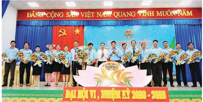
Ban Chấp hành Hội Nông dân xã Vĩnh Hòa nhiệm kỳ 2023-2028

Trước hết, Ban Chấp hành xây dựng quy chế làm việc, phân công nhiệm vụ cụ thể cho Ủy viên Ban Chấp hành, thường xuyên củng cố, kiện toàn Ban Chấp hành của các chi - tổ Hội nhằm duy trì sinh hoạt định kỳ, thu hút, nâng cao chất lượng hội viên tham gia và thực sự gắn bó với tổ chức Hội. Để thực hiện tốt nhiệm