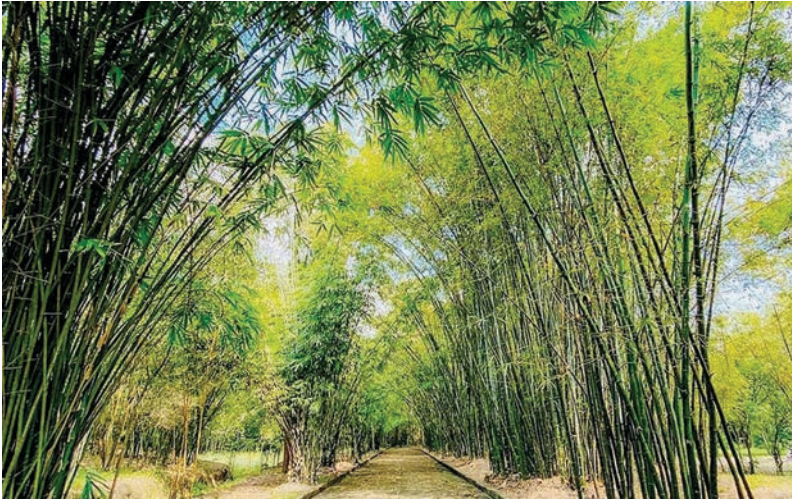
Làng tre tại xã Phú An, thành phố Bến Cát

nông nghiệp sinh thái đô thị theo hướng xanh, sạch và hợp tác liên kết trong chuỗi giá trị hàng hóa một cách bền vững trên cơ sở sử dụng tối ưu các nguồn tài nguyên.