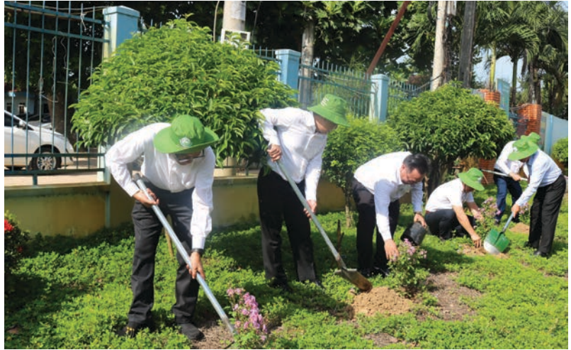
Các đại biểu tham gia trồng cây bảo vệ môi trường tại Lễ phát động hưởng ứng Ngày môi trường thế giới 5/6